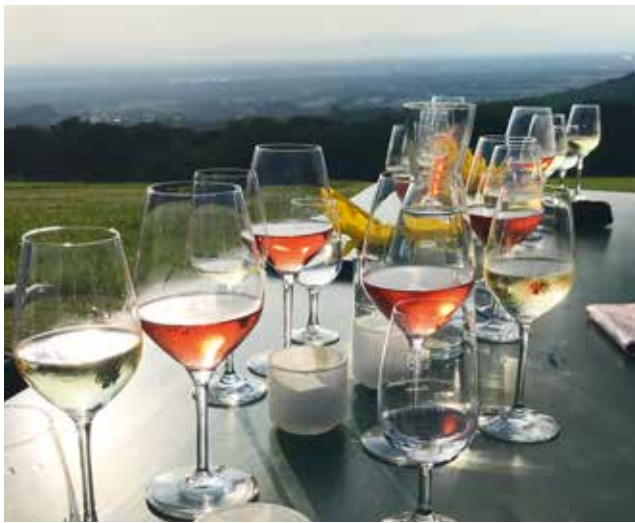
Impressionen von Ecktive-Grill 2019 mit Grill-on-Fire aus Müllheim, www.grill-on-fire.de