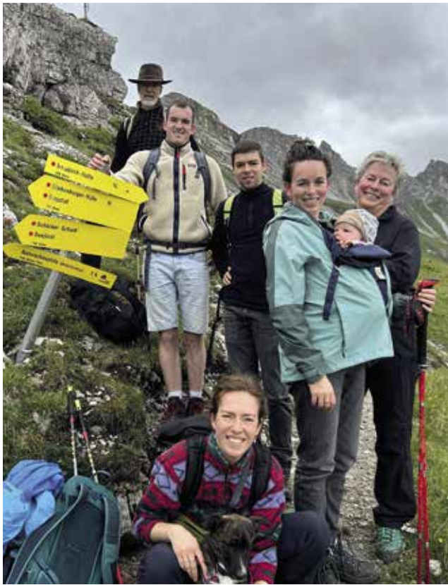
Hier die ganze Schindlerfamilie beim Familienurlaub.

Wir freuen uns, wenn wir mit Ihnen in Verbindung bleiben und wir Sie mit unseren Mauchener Wein- und Sektspezialitäten beliefern dürfen. Gerne versenden wir in Ihrem Auftrag Geschenke zur Weihnachtszeit oder für besondere Anlässe. Geschenkideen finden Sie in unserem Shop, oder auch in unseren Mailings, die wir Ihnen in unregelmäßigen Abständen gerne zusenden.